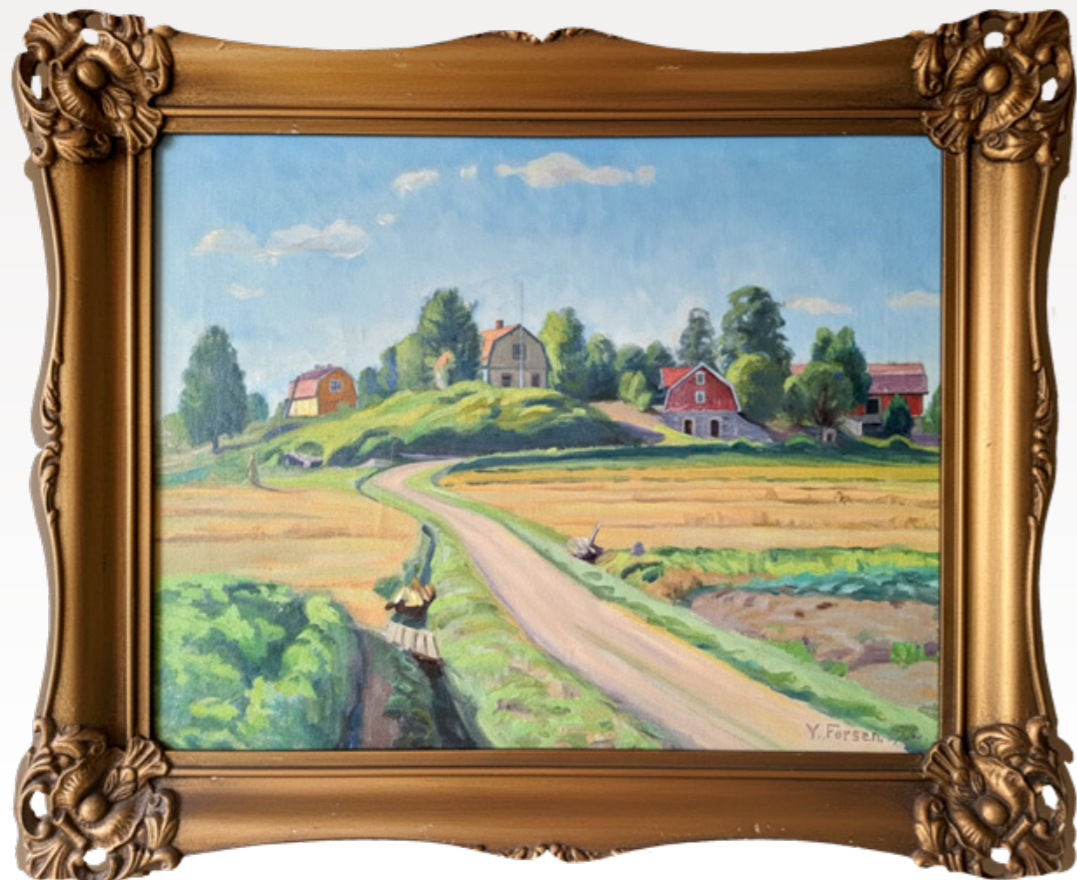
Yrjö Forsenin maalaus kartanon miljööstä 1930-luvulta.