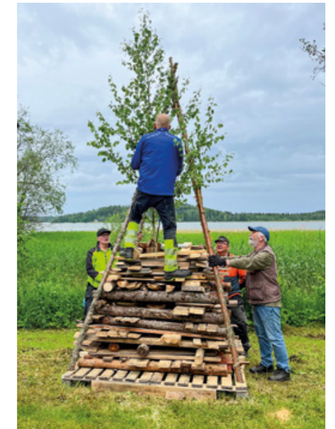
Talkoolaiset sääririkon pystytyksessä.

Tulevaisuudessa tavoitteena on löytää uusia kiinnostavia luennoitsijoita ja aiheita. Myös paikallishistorian ylläpitäminen koetaan tärkeäksi. Kesälle on jo suunnitelmia: kesäkuussa juhannusjuhla, elokuussa järjestetään kyläläisten saunailta Parinpellossa sekä talkootilaisuus juhannusjuhlassa mukana olleille