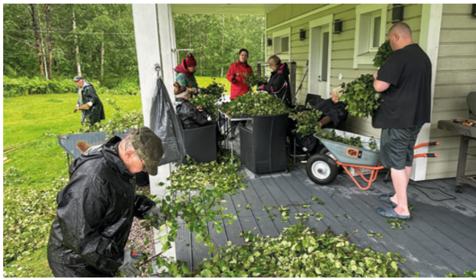
Vihtatalkoissa syntyy vihdat Marian Joulutorille.

Kyläyhdistyksen vihdat ovat olleet joulutorilla vuodesta toiseen suosittuja: ne menevät nopeasti kaupaksi ja ovat usein loppuneet kesken jo lauantaina. Aiemmin vihtoja on tehty noin sata kappaletta, mutta tänä kesänä tavoitteena on