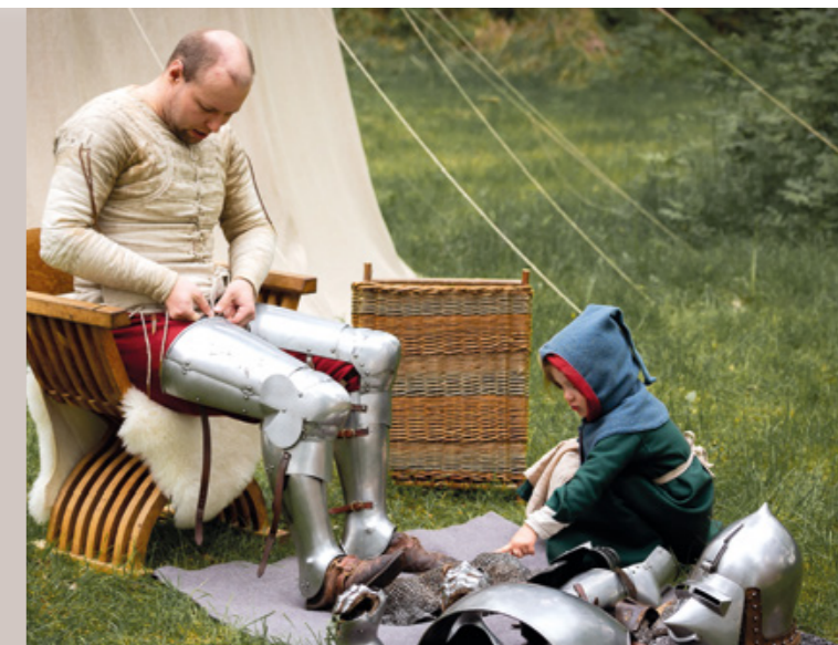
■ Teksti: Eila Karhu

Tule kokemaan historia elävänä ja viettämään unohtumaton kesäviikonloppu Hollolan kirkonkylällä. •