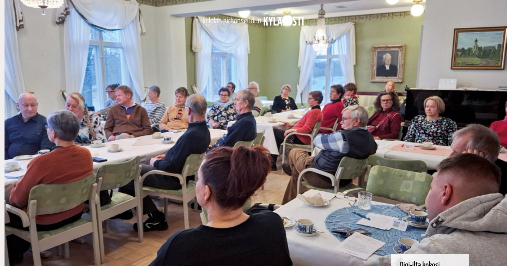
Digi-ilta kokosi kyläläisiä oppimaan uutta digimaailmasta.

Salpakangas, Prisma-keskus Kansankatu 8, Hollola puh. (03) 878 610 www.hollolanapteekki.fi Osta verkosta ja nouda apteekista, noutoautomaatista tai Postista. Avoinna: ma-pe 8.30 – 19 la 9 – 16 su suljettu