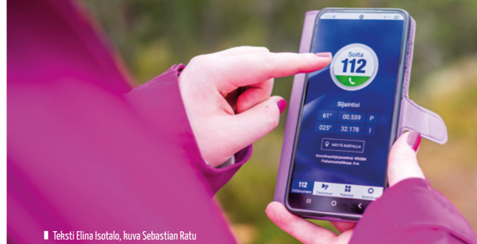
■ Teksti Elina Isotalo