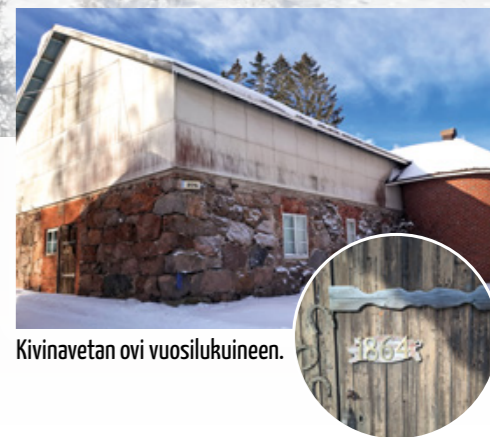
Kivinavetan ovi vuosilukuineen.

Aino Rosendahlin kerrotaan ihastuneen tähän maisemaan ensikäynnillään. Kuva on otettu kartanon parvekkeelta; etualalla avautuvat kartanon pellot ja Vesijärvi, taustalla siintää Hollolan kirkonkylä.