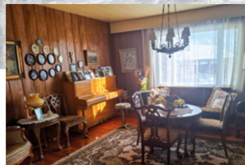
Sisätiloissa on säilynyt kartanon tunnelma. Perinteinen kalustus ja seinillä esillä olevat perhekuvat yhdistävät menneet ja nykyiset sukupolvet.

Aino Rosendahlin kerrotaan ihastuneen tähän maisemaan ensikäynnillään. Kuva on otettu kartanon parvekkeelta; etualalla avautuvat kartanon pellot ja Vesijärvi, taustalla siintää Hollolan kirkonkylä.