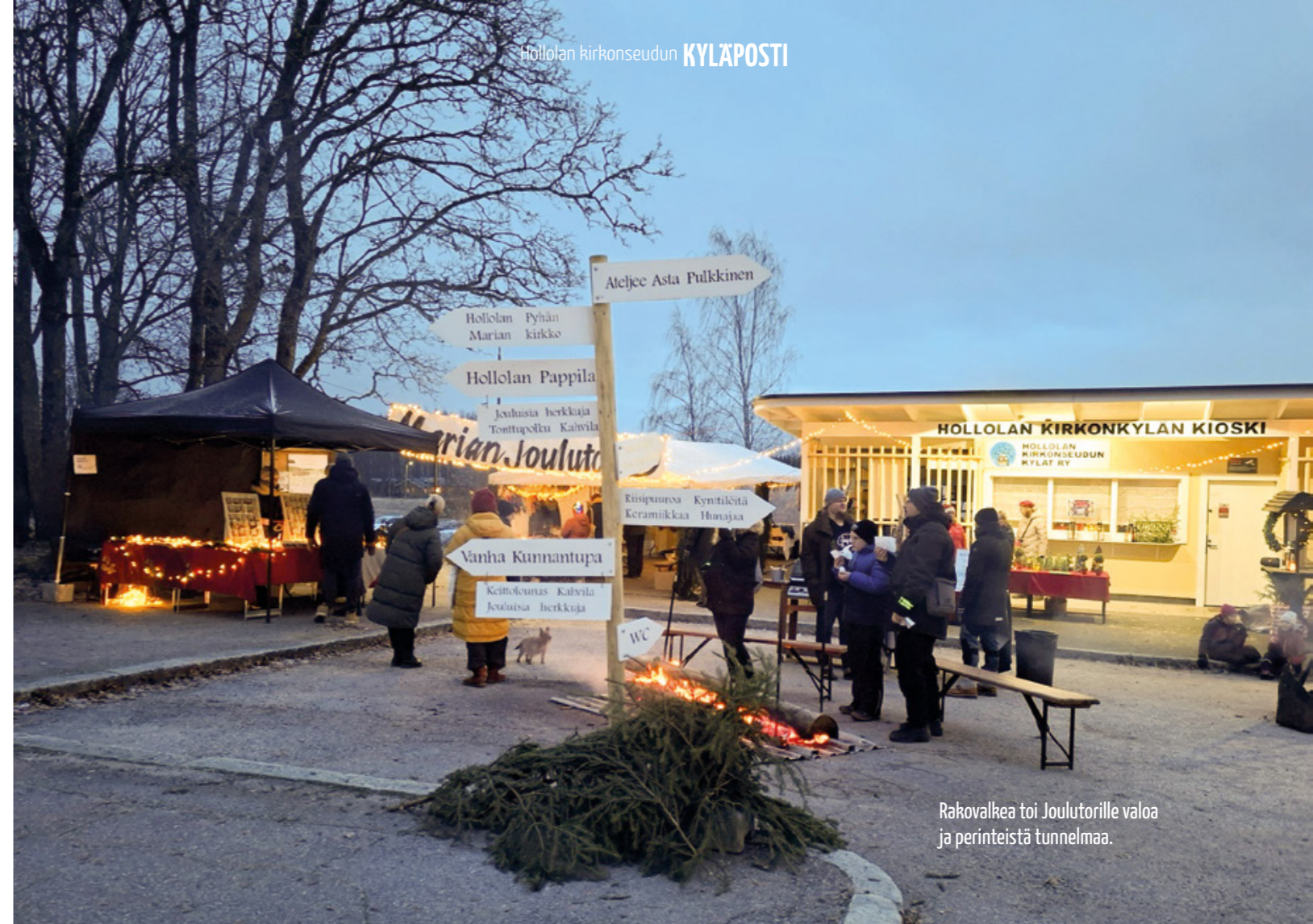
Rakovalkea toi Joulutorille valoa ja perinteistä tunnelmaa.

kysyntään. Tarkemmat tiedot talkoiden ajankohdasta ja käytännön järjestelyistä julkaistaan lähempänä tapahtumaa kyläyhdistyksen Facebook-sivulla. •